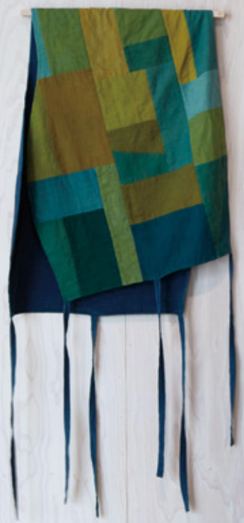
Colorful patchwork textile with blue ribbons.