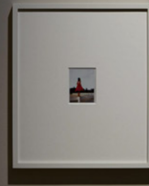
馬 2021年11月11日 撮影: Charlotte Dumas 2021年11月11日 撮影: Charlotte Dumas

Today, perhaps more than ever, we are challenged to see nature and life in a new light, as we face the pandemic now engulfing the world. Dumas tells us, 'we are in fact only able to co-exist within the context of all other living things,' and thus her works offer us opportunities to reflect on the ephemerality of life— that all life will eventually breathe its last, be it of an child or a foal, returning to an eternal sleep.