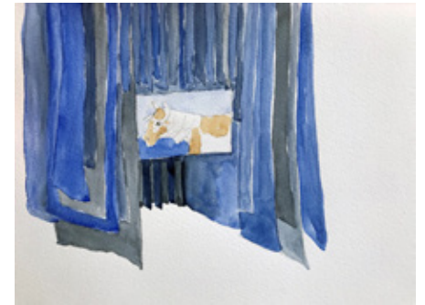
2 シャルロット・デュマによる本展のためのドローイング Drawing by Charlotte Dumas of the installation for this exhibition.