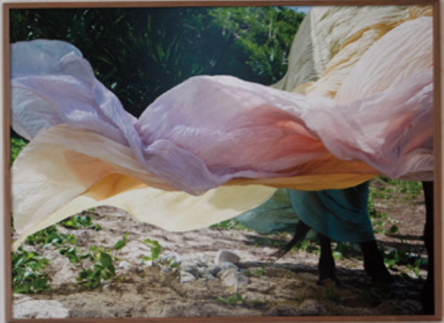
Person wearing a large, colorful, flowing garment.