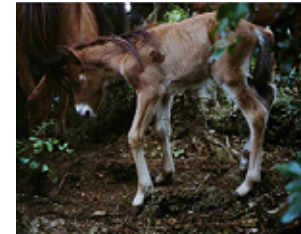
3 《エミ / 宮古島》 Emi, Miyakojima 2015 顔料インクジェットプリント Pigment inkjet print 30 x 37.5 cm