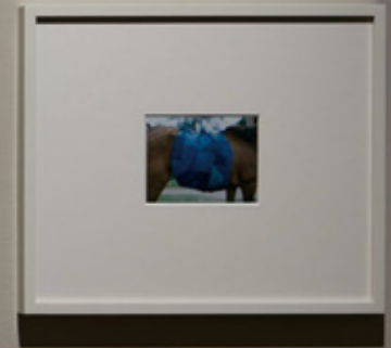
馬 2021年11月11日 撮影: Charlotte Dumas 2021年11月11日 撮影: Charlotte Dumas