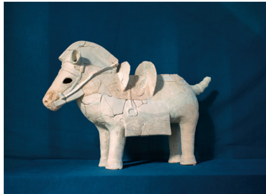
44～45頁の写真はシャルロット・デュマが本展のための来日時に埴輪のポートレイトとして自身で撮影した。 The photographs on pp.44-45 were taken by Charlotte Dumas herself as portraits of haniwa when she was in Japan during this exhibition.