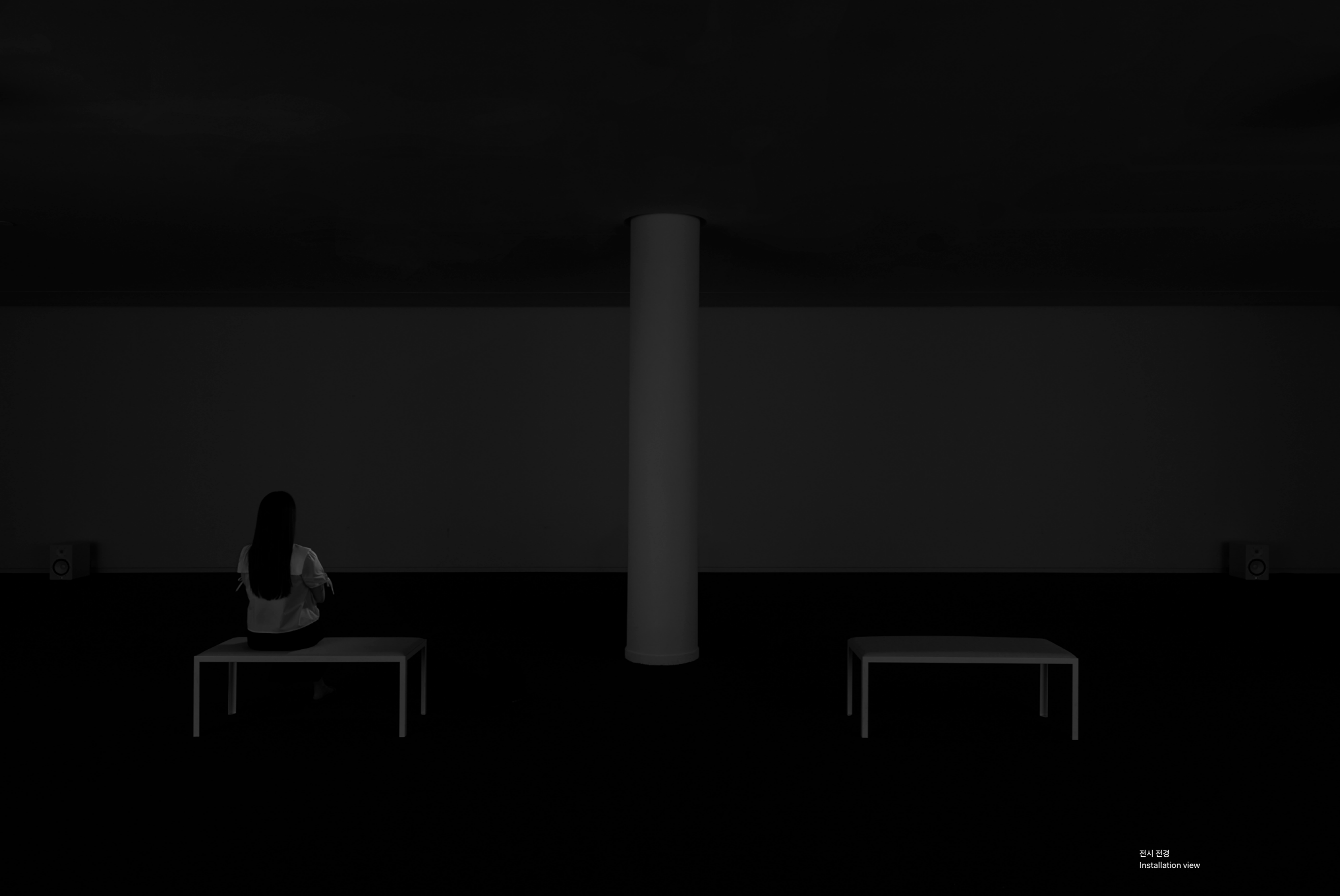
전시 전경 Installation view